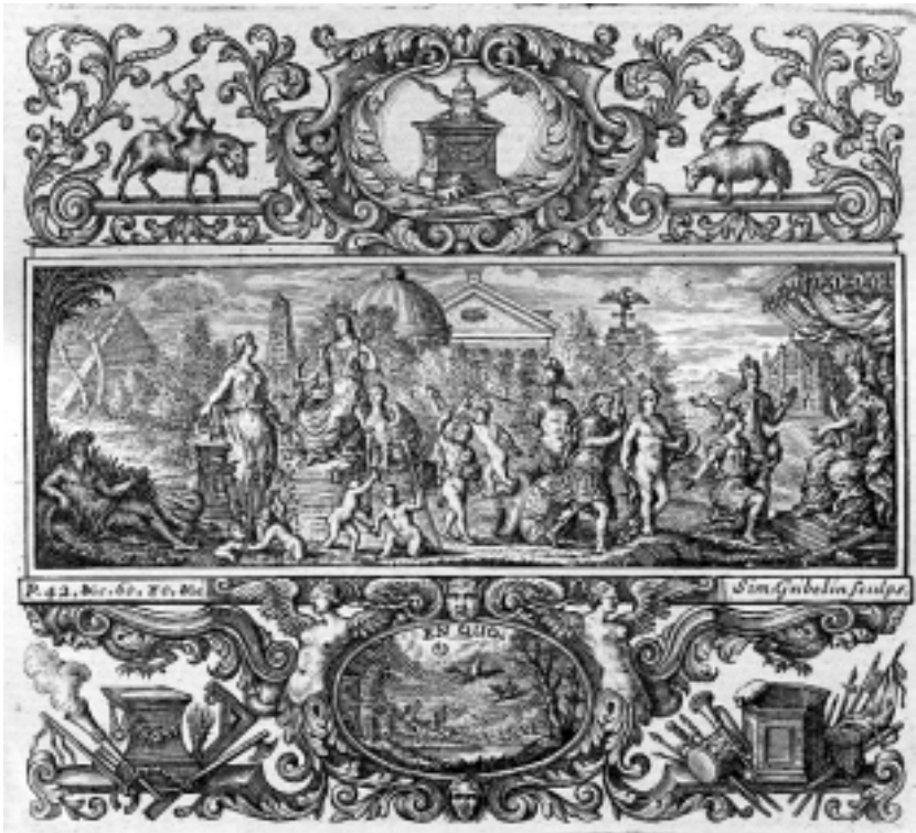
Abbildung 3: Frontispiz zu Miscellaneous Reflections (1714/15)

Shaftesbury kennt die Brisanz der gestochenen Kritik. Schon die geschriebene ist deutlich genug. Sie bleibt aber zumeist bei allgemeinen Bestimmungen, die für mehrere Einzelfälle falscher Religiosität gelten und überläßt es letztlich dem Leser, auf welche Denomination er die Kritik (nicht) beziehen will. Die gestochene kann einen solchen Spielraum kaum einräumen. Sie stellt Einzelnes dar.